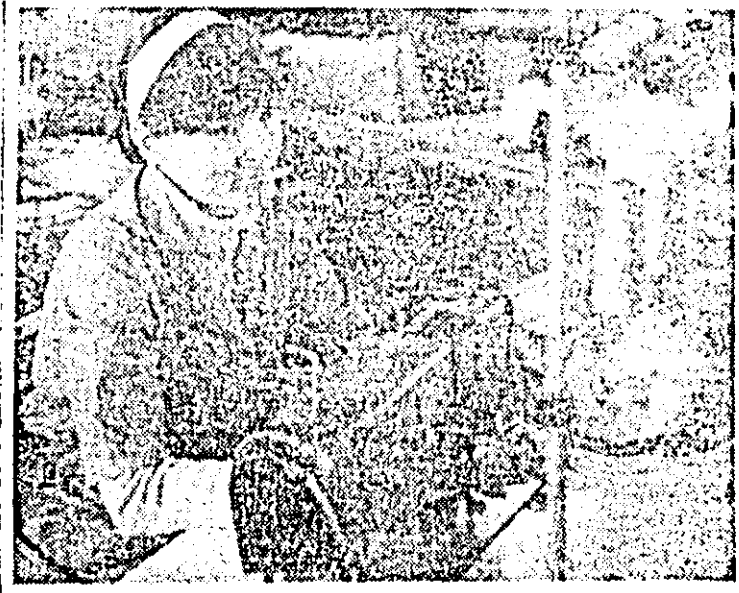
Frunză în întrecerea socialistă, comunistă Viorica Nichifor de la Întreprinderea de confecții, sector III, se bucură de multă apreciere.