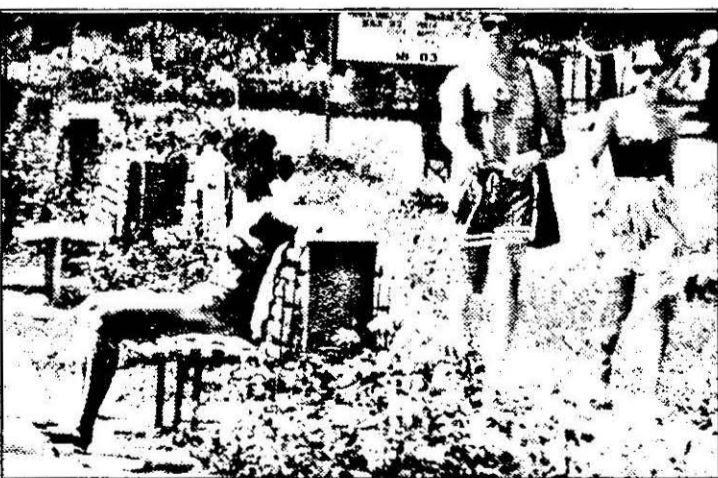
Ștrandu-i aici, marea-i departe... De ce oare?!...