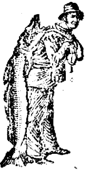
Az Emulsió vételénél a SCOTT-féle eljárás védjegyét — a halászt — kérjük figyelmezően venni. Utánzatoktól óvakodjunk!

által okozott kinokat jelentékenyen csökkenti a SCOTT-féle Emulsió már az első egynéhány adag után. A számarköhögés enyhítésére a SCOTT-féle Emulsió kitűnő alkalmazhatóságát a legtisztább és legkiválóbb alkatrészek, valamint a maga nemében páratlan SCOTT-féle eljárás biztosítják. A