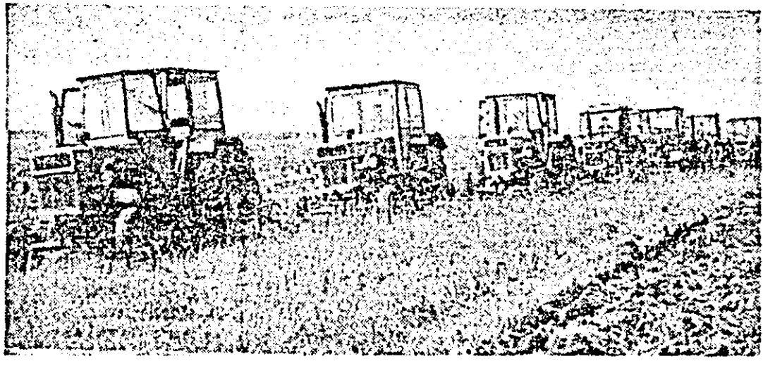
Mille de cai-putere care brăzdează ogoarele județului — o dovadă elocventă a grijii partidului pentru modernizarea agriculturii.