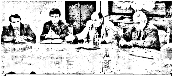
Primul pas a fost făcut. UTA discută cu oficialitățile locale. Sperăm că nu în zadar, ca-n alte dăți...

Dacă la începutul discuțiilor dl. Voicu avea o nelămurire: De ce o firmă ca Darimex sponsorizează Gloria Bistrița și nu pe UTA?, spre final a spus: „Eu sunt un tip gata lămurit...” Zău, că nu mai înțelegem nimic. Așa cum, nu pricepem, cum de numai o parte a consilierilor sunt de vină, că, vezi Doamne, nu au venit cu un proiect de hotărâre de ajutorare a UTA-ei. Dar, dumnealui, ca ales al