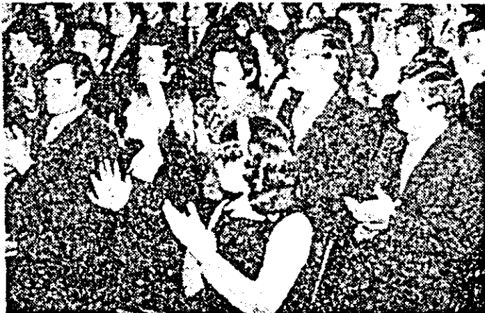
Aspect din sală în timpul desfășurării lucrărilor conferinței.