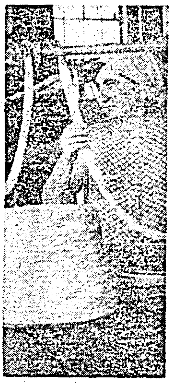
Filatoarea Volchița Runa este una dintre cele mai apreciate frunze în întreprinderea socialistă de la sectorul II al întreprinderii textile.