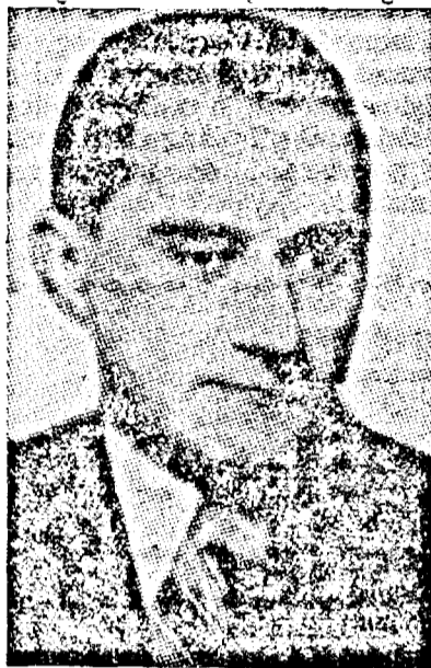
D. MIHAI ANTONESCU Vicepreședintele Consiliului de Miniștri

O expresie caracteristică a poporului român, de care trebuie să se țină seama în reconstruirea lumii noi, este vitali-