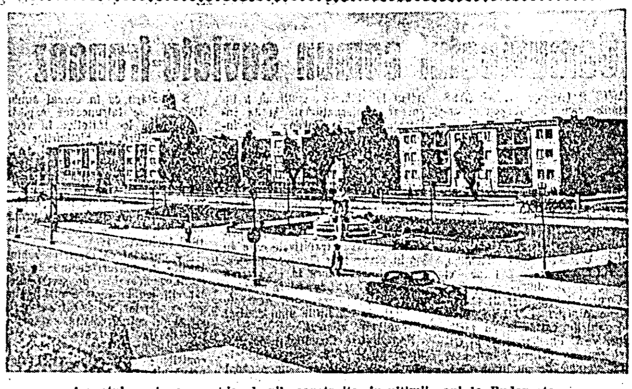
Aspectul unui nou cartier de vile construite în ultimii ani la Budapesta