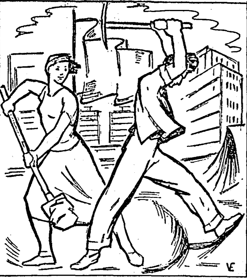
EMIL VITROEL „La muncă voluntară”