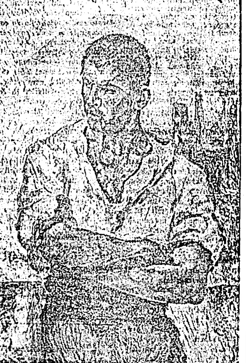
OCTAV BĂNCILĂ „Grevistul”

ză tematica proletară datează din 1905 și se intitulă „Muncitor” și „Muncitor în repaus”. Ele nu trădează o altitudine compasivă din partea autorului ci dimpotrivă surprînd, viguroasa vitalitate a clasei, creînd prototipuri puternice și conștiente, adevărați reprezentanți ai muncitorimii combative, care personifică însăși conștința de clasă a proletariatului. Inspirare din mediul muncitoresc: „Intrunirea”, „La nicovală”, „Cizmarul”, „Lemnarul”, „Muncitorul” etc. realitate în perioada dintre 1910-1916 se remarcă prin accentele de critică socială și prin substratul lor revoluționar. Intre 1914-1916, cînd vîltoirile vrăjmășiei dintre popoare cuprîndînt continentul european, se apropiau de granițele noastre, Băncilă pictează compoziții militante ca: „Revoluția și dreptatea” și „Pax”, lucrare ce dezvăluie fără echivoc poziția proletariatului față de primejdia iminentă a războiului. Muncitorul puternic din pictura intitulată sugestiv și atotcuprinzătoare „Pax”, cuvînt lansat ca o supremă chemare a păcii și buneii înțelegeri între oameni, frînge în două cu o viguroasă mișcare a pictorului lama săbiei, a săbiei ce apare ca un simbol al discordiei și războiului. Băncilă a întrevăzî și necesitatea alianței dintre clasa muncitoare și țărănimia muncitoare, pe care o exprimă în compoziția: „Ce mal scrie la gazeta” sau „Muncitorul și țaranul”, înfățișînd un tînăr țaran căruia munc-