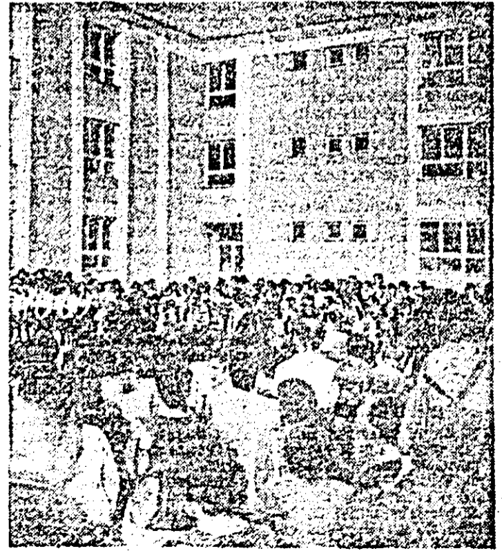
Un dar de 21 de clase făcut elevilor arădeni: Școala generală nr. 21 din Calea Aurel Vlaicu.