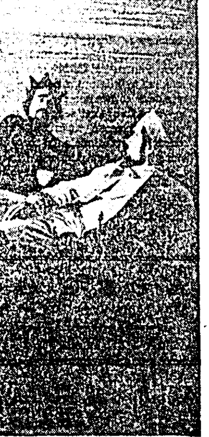
... și din „Despot Vodă” de V. Alexandri