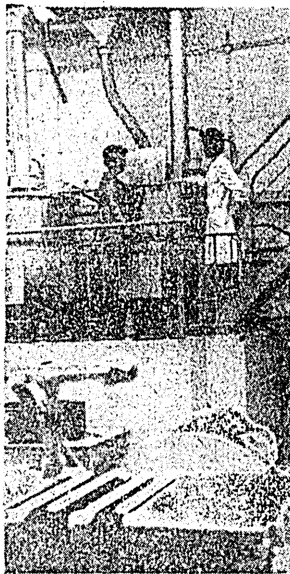
Întreprinderea „7 Noiembrie” din cadrul Combinatului alimentară Arad. Imagine cotidiană din secția preparate la fabricii de lichior.

În acest an, cercetătorii dobrogeni continuă experimentările în vederea introducerii în producție a hibrizilor simpli de floarea-soarelui 52 și 53, cu o producție de aproape 4.000 kg la hectar, procent mare de ulei, precocitate și cu caracteristici care permit mecanizarea în întregime a lucrărilor de înțetire și recoltare. Ei au prevăzut, de asemenea extinderea mai multor soluri de grîu în cultură irigată, furnizarea de sîmînțe, și generalizarea metodei cu ajutorul căreia se obțin anual două recolte de grîu de pe aceeași suprafață.