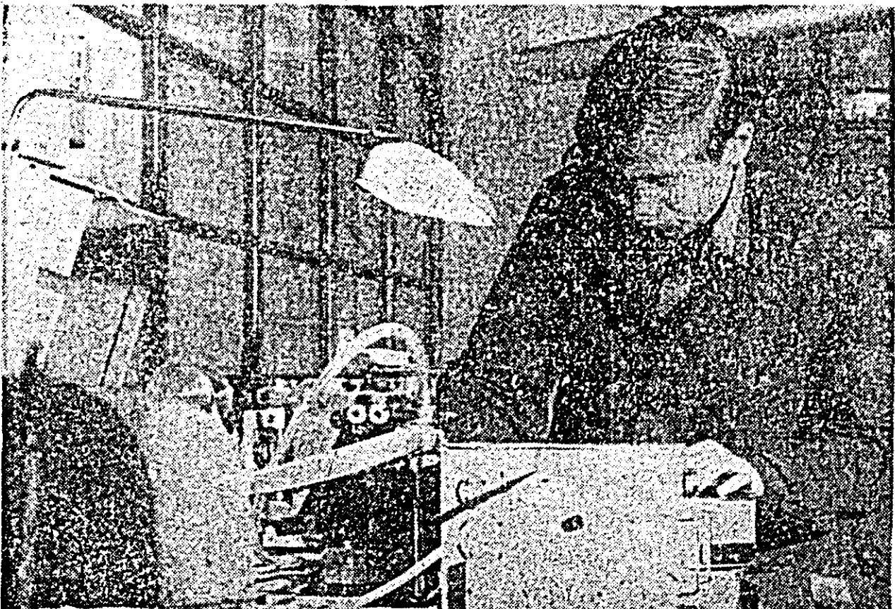
La fabrica „Victoria” fondurile de investiții se concretizează în utilaje tot mai perfecționate. UN FOTOGRAFIE — o nouă mașină de leput suprafețe de ghidare.