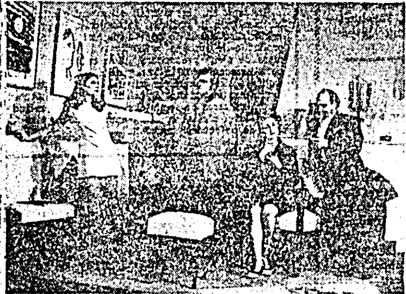
Moment din spectacolul cu piesa „Camera de alături” de Paul Everac

— În paginile ziarului nostru am avut adesea plăcerea de a comenta la pe un fapt pozitiv frecventele așteri ale teatrului arădean din umeri ai unor români, clasici și contemporani. Știați înainte de obținerea