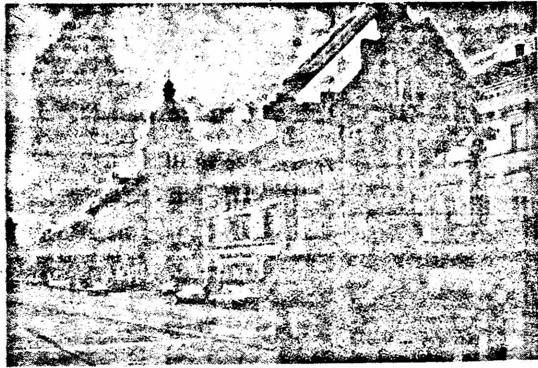
În memoriam. Piața Revoluției din Arad.