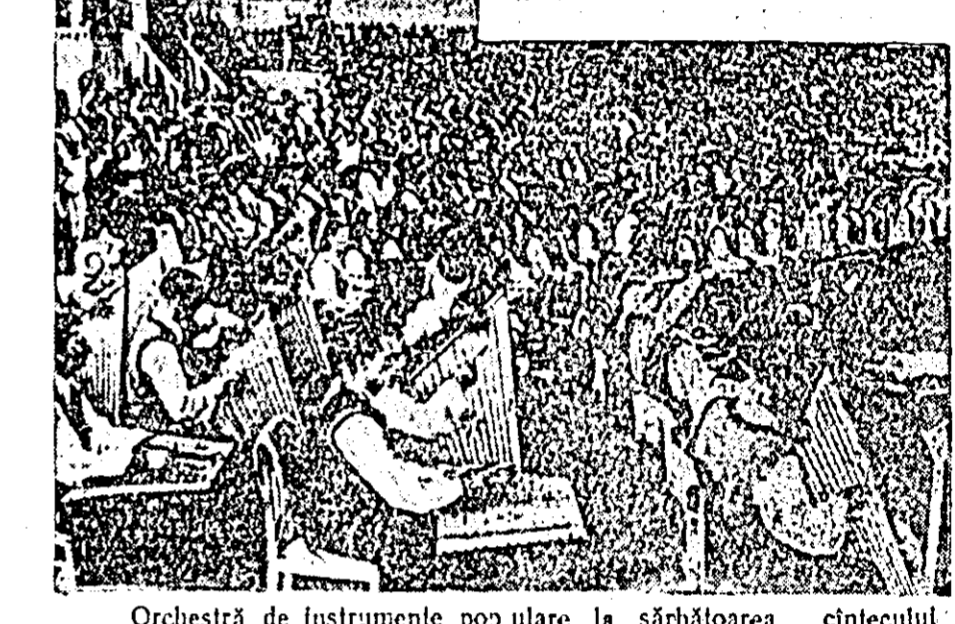
Orchestra de instrumente populare la sărbătoarea cîntecului în Vilnius.