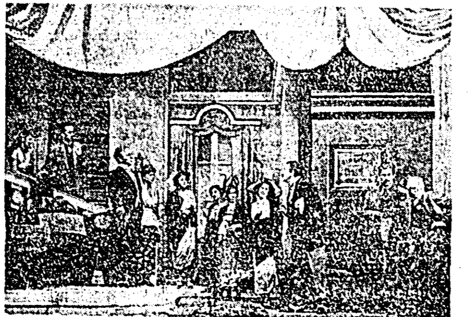
În clișeu: O scenă din spectacolul „Doctor în filozofie”.

Nemulțumit de tot ce vede în jurul său, nemaisuportînd spiritul obtuz al mediului în care își desfrășoară activitatea, tîndrul nostru profesor se transferă la un liceu militar, unde va înfîlni o atmosferă militaristă, o prezență mai virulen-tă a accluiasi ațacerism și lipsa de scrupule în activitatea profesională și socială. Viața politică a tineretului capdă un accent sport în transformarea iminent fascistă. Se înfăinează străjeria, iar Ignădrescu e numit ministru al Propașcoail în provincie, desfrăsoară o activitate valoroasă, cu perspective de a ajunge în virful ierarhiei culturale, dacă viața nu i s-ar limita la clevea aventuri amoroase și n-ar da dovadă excedentară că e un produs tipic al micii burghezii.