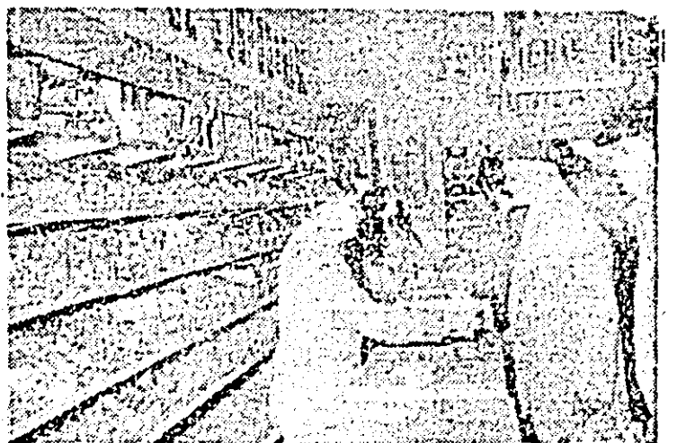
Aspect din noul magazin „Tehnometal” deschis pe str. Cernel.

tru cei care nu au apelat pînă în prezent la serviciile oferite de C.E.C., cit și pentru informarea mai completă a depunătorilor vă prezentăm avantajele generale de economisire la C.E.C. care sînt: dobînzi și cîștiguri; garanția statului; secretul privind numele depunătorilor și a operațiunilor efectuate; imprescriptibilitatea depunerilor, a dobînziilor și a cîștigurilor; scutiri de impozite și de taxe; dreptul de a împuternici alte persoane să dispună de sumele păstrate la C.E.C.; dreptul de condiționare a restituirii depunerilor. Casa de Economii și Consumațiuni ține întreaga evidență a depunerilor și restituțiilor pe baza numărului de libret. Deoarece nu există o evidență nominală a depunerilor, cunoașterea numărului de libret de către titularul acestuia este deosebit de utilă în cazul pierderii sau sustragerii libretului. De aceea recomandăm a se păstra talonul cu numărul de libret separat de acesta pentru a-l avea oricînd la îndemînă.