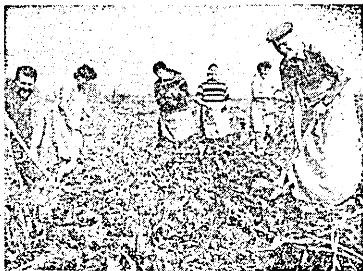
La fel ca în toate unitățile agricole din județ și la C.A.P. Aradul Nou se lucrează cu toate forțele la recoltatul steclei de zahăr.