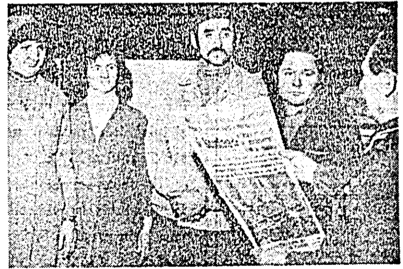
În pauza de masă, zărele care publică Raportul prezentat de tovarășul Nicolae Ceaușescu, sînt urmările cu deosebit interes.

Rezultatele cu rezultate înaintate pe cele de la I.S.A., I.V.A., L.I. „30 Decembrie”, liceul nr. 1, 2, 3 și 8, Liceul „Ștefan cel Mare” ori organizațiile Ineu, Sebis, Peșca ș.a.