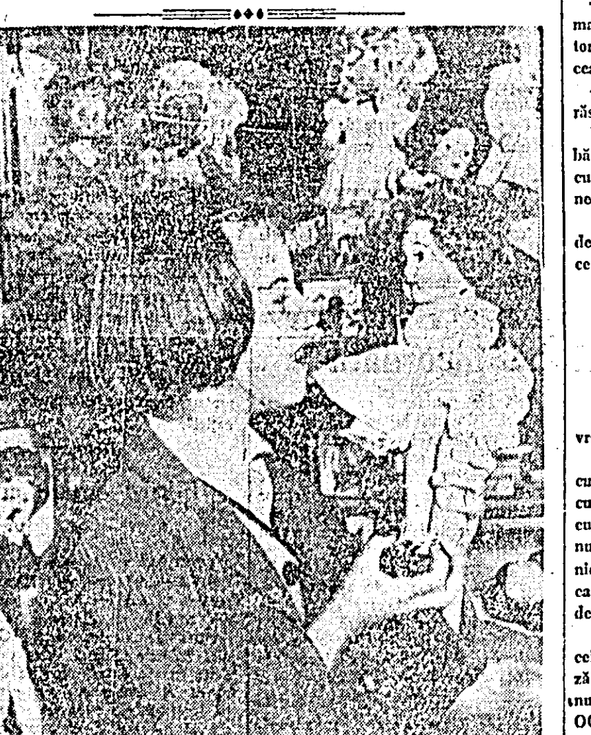
ÎN CLIȘEU: Aspect din magazinul nr. 112 pentru desfacerea jucărilor, al OCL „Produce Industriale”.

Am reținut din nou și cu această ocazie finuta artistică în care s-au prezentat unele formații, printre care amintim brigada artistică de agitație a întreprinderii „Tricolor roșu”, corul și fanfara Uzinelor de vagoane, dansurile populare de la Uzinele textile „30 Decembrie” etc. Surprinde însă în același timp lipsa din spectacol a unor formații frumuse (brigada artistică de agitație și formația de dansuri) de la cooperativa „Artex”.