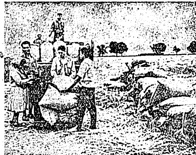
Sacii plini de orz din noua recoltă stau stîlțuți la marginea drumului dintre holde. Se „odihnesc” înocmai unor purceluși întinși la soare... Dar încă a sosit camionul. Peste puțin, sacii sînt cîntăriți, mașina încărcată și direcția... magazin.