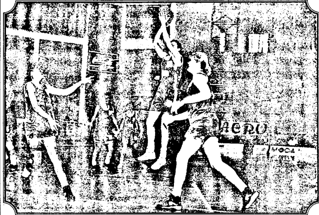
Aurora Dragoș se înalță superb și aruncă la coș, reușind din nou să puncteze pentru selecționata noastră (fază din meciul România - Slovenia).