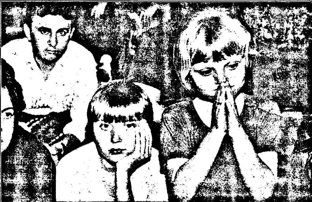
Emoțiile meciului, vizibile pe fețele celor mici și celor mari...