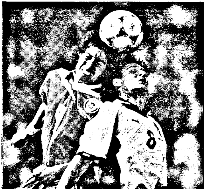
Zamorano și Pfeffenberger - un duel de la egal la egal