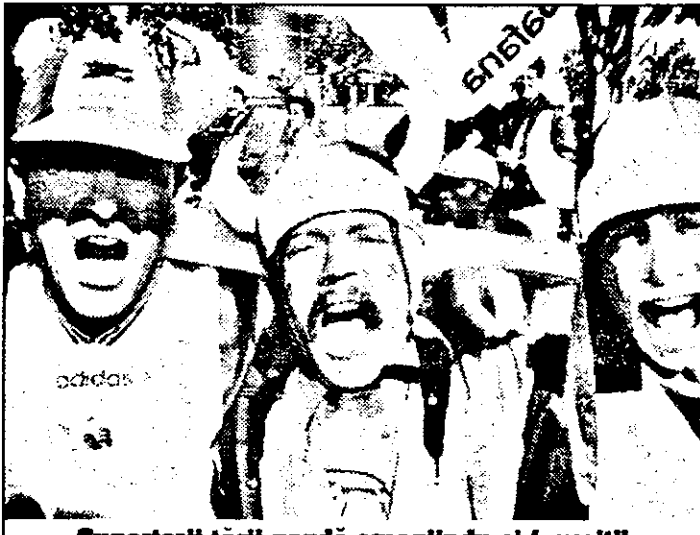
Supporterii țării gazdă omagîindu-și favoriții. Azi, în caz de victorie cu Arabia Saudită, francezii fac pasul spre optimi.