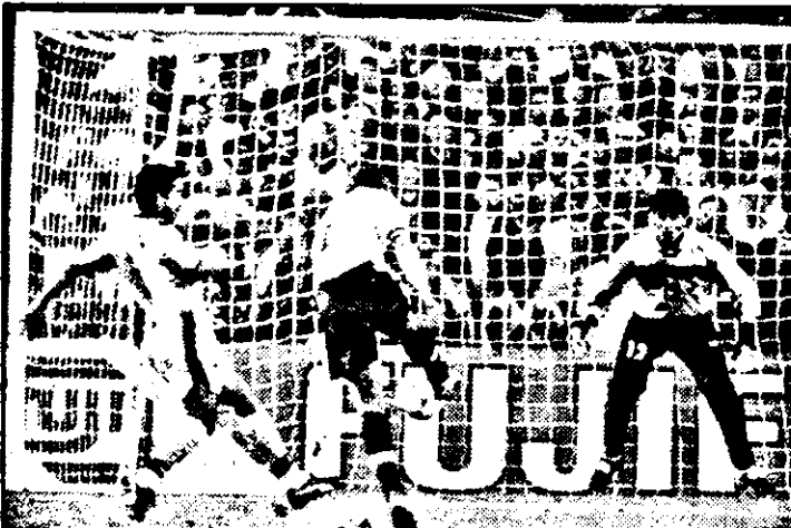
Cel mai cotelat fotbalist al planetei, Ronaldo, scutura plasa porții marocane...