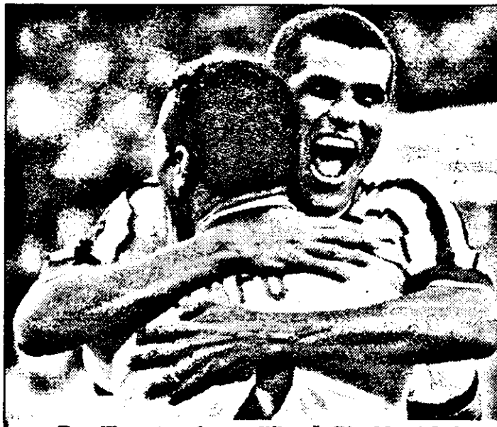
...Brazilia este prima calificată. Rivaldo și Cafu se îmbrățișează în culmea fericirii. La Nantes samba a jănit până în zori!