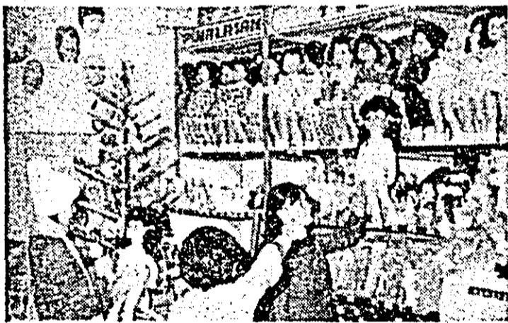
Instantaneu la raionul jucării al magazinului „Căminul”.