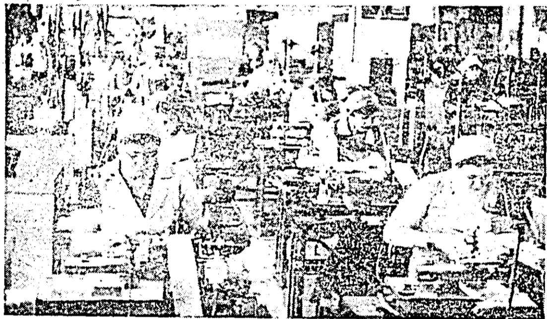
Aspect de muncă în secția uzină — strunguri automate — a întreprinderii „Victoria”.