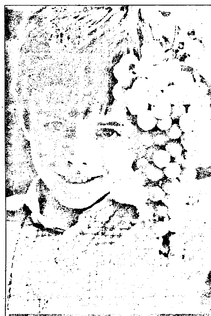
Uite ce am eu!