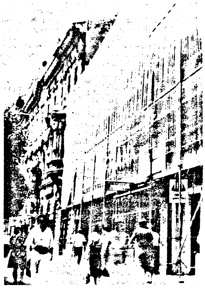
Un alt mod de a lucra...

Dacia 1310 S Berlină - 2.086.776 lei. Dacia 1310 L Berlină - 2.159.725 lei. Dacia 1310 S Break - 2.284.000 lei. Dacia 1310 L Break - 2.371.585 lei. Oltcit Club 11 RL - 2.115.015 lei Oltcit Club 12 TRS - 2.401.225 lei. ARO 10.1 - 3.061.565 lei ARO 10.4 - 3.121.454 lei ARO 10.8 - 2.997.625 lei ARO 10.9 dublă cabină - 3.343.220 lei