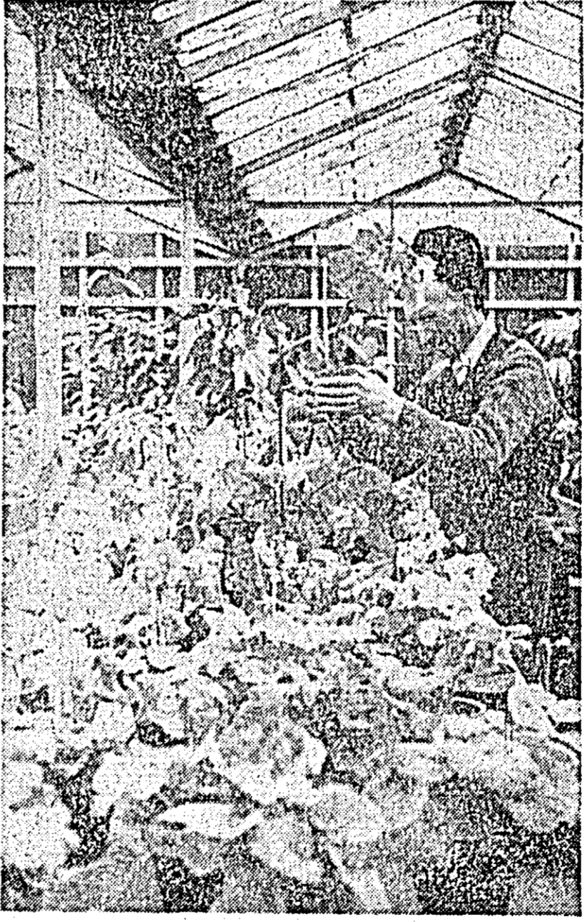
Aspect din sera de flori a Fabricii de mobilă.