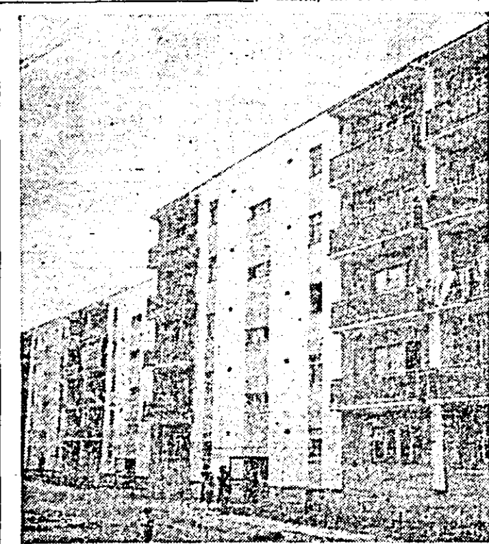
Noi și noi zone de locuințe moderne... O imagine intrată deja în obișnuitul Aradului zilelor noastre.

În viltoarea galeriei de artă a muzeului • Consemnări • Cenaclu • Fotbal Euro '84 • Buna gospodărire a localităților nu e numai treaba primăriilor • Concursuri ale Crucii Roșii • O emoționantă întâlnire literară.