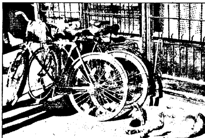
La noi, bicicletele sunt păzite. Mașinile se fură!

În caz de deces, la Biroul de stare civilă se pot face înregistrări zilnic, între orele 8-14.30 (marți, joi și între orele 8-17), iar sâmbătă și duminică între orele 9-11.