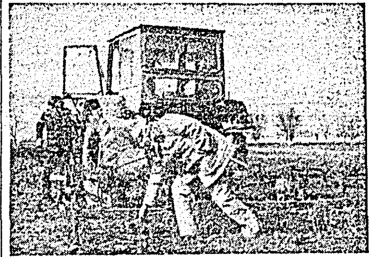
La Stațiunea de cercetare și producție legumicolă Aradul Nou, pregătirea terenului pentru însămînțări I se acordă o deosebită atenție.