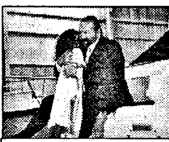
18,10 Doi superpolițiști la Miami - s.pol.am: Diamante

7,40 Magazinul satului 8,25 Desene animate 8,50 Cuvântul Domnului 8,55 Abecedar calculatoare 9,30 Desene animate 10,00 Sărbătoarea națională a Republicii Ungare aprox. 10,20 Revoluția ziariștilor - forum 11,00 Depuneri de coroane 11,40 Drumuri pe Dunăre - doc. 12,00 Documentar muzical 13,00 Teletext, meteo 13,05 Șamanii - atunci și astăzi doc. III/2 13,45 Viena, orașul viselor mele - f.Germania 15,35 Greșala istoriei?