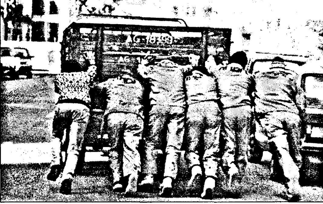
Nu-i benzină? Merg și cu „hei-rup!”...