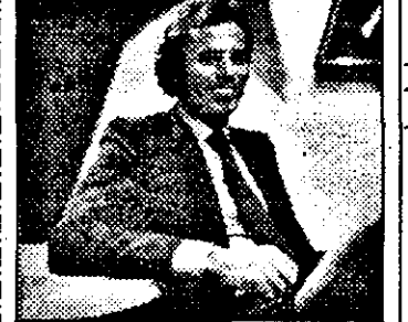
BUDAPESTA 2 16,15 Iglesias - reportaj

7,00 Știri NBC 8,00 Grupul Mc Laughlin 8,30 Hello, Austria - magazin 9,00 Știri ITN 9,30 Jurnal european 10,00 Video-moda 10,30 X-Press Entertainment 11,00 Rolonda - talkshow 12,00 Super shop 13,00 Magazin informativ NBC 14,00 Azi - magazin informativ 15,00 Sport-magazin: motociclism 16,00 Golf 17,00 Auto 18,00 Volei pe plajă 19,00 Azi - magazin informativ