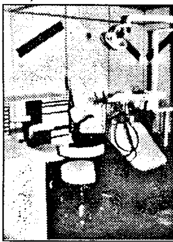
Ne place, nu ne place, din când în când suntem nevoiți să ne „relaxăm” în scaunul stomatologic. Și atunci e bine să fie cât mai „comod”...