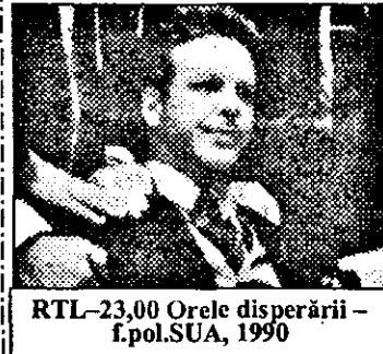
RTL-23,00 Orele disperării - f.pol.SUA, 1990

6,28 Prezentarea programului 6,30 Viata satului 6,50 Jurnal regional 7,00 Magazin matinal. Din cuprins: 7,01 Știri 7,40 Reuters - jurnal economic 7,55 Povestii 8,00 Magazin informativ 10,00-13,00 Magazin. Din cuprins: 10,30 Riviera - s. 11,30 Dallas - s.SUA: Întâlnire 13,00 Știri 13,05 Magazin economic 13,55 Teletext 15,45 Sistemul solar - doc.Germania, IV/4 - Planetele exterioare 16,15 Viata satului 16,35 Curs de limbă engleză 17,00 Știri, meteo 17,05 Afaceri 17,15 Prezentarea programului 17,25 Călători pe mare - doc.s.Anglia: Insulele Hawai 18,00-20,30 Vineri după-masă. Din cuprins: 18,00 Emisiunea vârstnicilor 18,30 Informații utile 18,40 Fereastră - mag.informativ - supliment