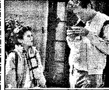
SAT 1-21,15 Unul în pielea celuilalt - comedie SUA, 1988

14,30 Vaporul iubirii - s.SUA: Crimă pe punte I 15,30 Superboy - s.SUA 16,00 Star Trek - s.açt.SUA 17,00 Mac Gyver - s. açt. SUA: Numărătoare inversă