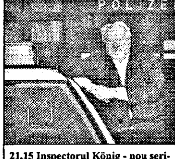
21,15 Inspectorul König - nou serial pol.Germania

7,25-10,10 Desene animate 10,05 Cum ieși din Galaxie, pe stânga - s.sf.Australia 10,40 Tarzan - s.SUA 11,05 Zorro - s.SUA 11,30 Lumea jocurilor video