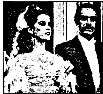
Budapestal-17,30 Domnișoara - nou serial Brazilia 170/1

6,30 Viața satului 6,50 Jurnal regional 7,00 Magazin matinal 7,01 Știri 7,40 Reuters - jurnal economic 7,55 Povesti 8,00 Magazin informativ 10,00-13,00 Magazin. Din cuprins: 10,30 Riviera - s. 11,30 Okavango, inima sălbăticiilor - s.SUA, XIII/5 13,00 Știri 13,05 Magazin economic 13,55 Teletext 16,05 Prezentarea programului 16,10 Viața satului - rel. 16,30 Căltura cu multiple fețe - doc.am.XXI/14 17,00 Știri, meteo 17,05 Teletext '94 17,10 Concurs TV 17,30 Domnișoara - nou serial Brazilia 170/1 18,00 Dimensiune - magazin științific 18,40 Să vorbim corect! 18,55 Cronica catolică 19,15 Afaceri 19,30 Concurs TV - Măta-n sac