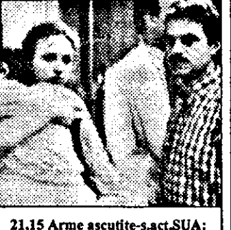
21,15 Arme ascuțite-s.act.SUA: Crimă fără martori

8,15 Lumea afacerilor 8,45 Buletin financiar 9,00 Știri ITN 9,15 Afaceri-magazin 9,30 Ediție internă 10,00 Super shop 11,00 Rolanda show 12,00 Magazin economic 13,30 Piața internațională 14,00 Azi-reportaj 15,00 Roata banilor-Wall Street Journal 16,00 Mag.de vacanțe 17,00 Visuri despre zbor 18,00 Amintiri de ieri și azi 18,30 Financial Times 19,00 Azi-mag.informativ 20,00 Știri ITN 20,30 Maeștrii frumuseții-nou serial: Emanuel Ungaro 21,00 David Bellamy pe vârful globu-