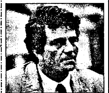
Budapestal-21,15 Colombo - s.pol.am.: Nu mai este timp pentru crimă

9,00 Știri ITN 9,15 Bursa SUA 9,30 Jurnal NBC 10,00 Super shop 11,00 Rolonda Walts show 12,00 Afaceri magazin 12,30 Magazin politic SUA 13,00 Magazin economic mondial 13,30 Financial Times 14,00 Azi - magazin informativ 14,30 Financial Times 15,00 Azi - magazin informativ 16,00 Roata banilor - informații de pe Wall Street 18,30 Financial Times 19,00 Azi - magazin informativ 20,00 Știri ITN 20,30 Ciclism - Australia 21,30 Dataline - magazin politic 22,30 Ediție internă 23,00 Știri ITN