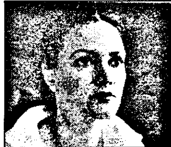
RTL-21,15 Tandemul - s.pol.Germania - Frumosul Igor

19,00 Totul ori nimic - concurs TV 20,00 Știri, sport, meteo 20,30 Roata norocului 21,15 Inspectorul König - s.pol.germ.: Glumă mortală 22,15 Hunter - s.pol.am.: O vechi