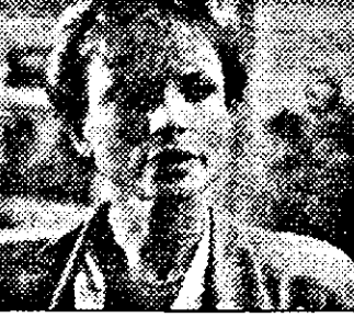
21,15 Anna Maria - O femeie își urmează calea-ep.3

7,00 Des.anim. 8,20 Familia Walton-s.SUA 9,20 Micuța noastră fermă-s.SUA 10,15 Capricornu f.SUA (rel.) 12,30 Compania celor trei-s.SUA 13,05 Sperietoarea și Mrs. King - s.pol.SUA 14,00 ingerii lui Charlie-s.pol.SUA 15,00 Arabella Kiesbauer show 16,00 Dinastia-s.SUA 17,00 Micuța noastră fermă -s.SUA 18,00 Des.anim.- 19,25 Liniștită noastră căsuță-s.SUA 19,55 Alf-s.distr.SUA 20,00 Super Mr.Cooper ! -s.SUA 21,00 Știri 21,15 Dosarele X - f.pol.Canada 22,15 Polițiștii din New York-s.pol.SUA 23,15 Magazinul de luni 0,15 Viziuni mortale-f.pol.SUA, 1990 cu Malcolm Mc.Dowell, Geoffrey Lewis 2,15 Renegade-s.act.SUA