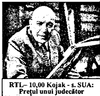
RTL- 10,00 Kojak - s. SUA: Prețul unui judecător

6,30 Viața satului 6,50 Jurnal regional 7,00 Magazin matinal 7,01 Știri 7,40 Reuters-jurnal economic 7,55 Povesti 8,00 Știri 10,00 Magazin. Din cuprins: 10,30 Rivera-s. 12,45 Jurnal economic 13,00 Știri 17,05 În așteptarea guvernului 17,30 Domnișoara-s. Brazilia 170/3 18,00 Mag. cultural european 18,45 Zodiac - Scorpionul 19,15 Afaceri 19,30 Concurs de literatură 20,00 Telesport 20,10 Des. anim. 20,30 Telematinal