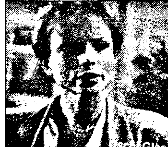
PRO7-21,15 Conspirația tăcerii - f. pol. Canada 1991

10,00 Superboy - s. SUA 11,30 Vecinii - s. australian 12,00 Tânăr și fără odihnă - s. SUA 12,55: 5x5 - conc. tv 13,30 Sub soarele Californiei - s. SUA: Eliberat de cătușe