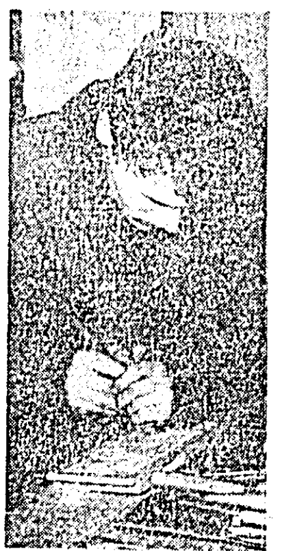
O înaltă măiestrie — aspect de muncă de la fabrica de mobilă din Arad.