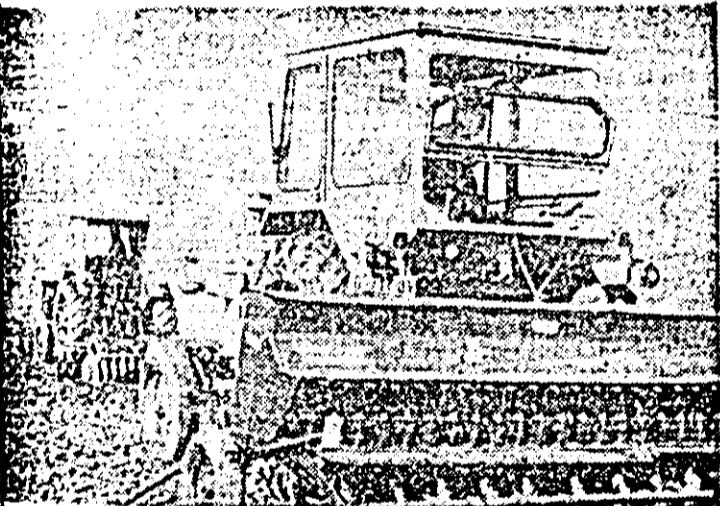
Pe ogoarele Sintanei mecanizatorii urgentează finalizarea semănăturii grîului.