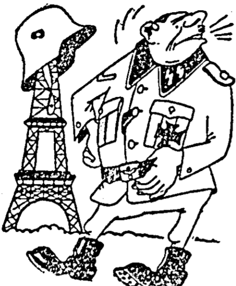
— Punct de vedere comun! Al cui, al?!

vința planurilor Germaniei occidentale în problema Saarului și să contribuie astfel la ratificarea acordurilor. Eri au început în Consiliul Republicii discuțiile asupra acordurilor de la Paris. Adepții acestor acorduri, pentru a asigura ratificarea, susțin că există un punct de vedere comun și deplină colaborare între semnatari. (Ziarele)