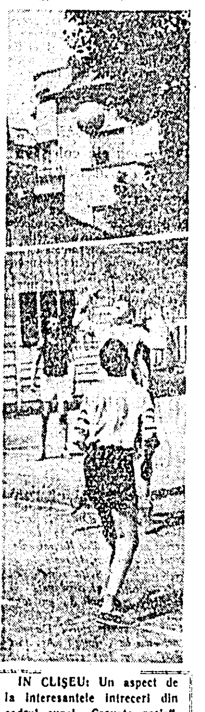
ÎN CLIȘEU: Un aspect de la interesantele întreceri din cadrul cupel „Cravata roșie”.

În turneul internațional feminin de baschet desfășurat la Marsilia, echipa RP Romine a învins cu 93:93 (24:23) reprezentativa Franței și s-a clasat pe locul II. Meciul dintre selecționatele RP Chineze și RP Ungare a luat sfârșit cu rezultatul de 43:36 (21:16) în favoarea sportivelor chineze. Clasăment final: 1. RP Chineze; 2. RP Romine; 3. Franța; 4. RP Ungară. Turneul final al campionatului republican masculin de handbal s-a încheiat la Onești cu victoria echipei din Dinamo București, care a învins din nou pe Steaua (16:12). Totalizând 12 puncte Dinamo reintră în posesia titlului de campioană a țării.