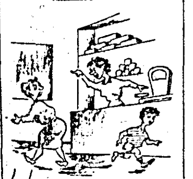
Afară! Cîntarul arată cit vreau eu nu cum vrei voi și nici cum vrea el!

Vînzătoarea Filimon Florica de la OCL Alimentara nr. 15 din cartierul Grădiște, se poartă urît cu cumpărătorii, îi repede sau îi dă pur și simplu afară din magazin, atunci cînd aceștia reclamă anumite nemulțumiri.