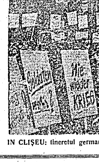
IN CLIȘEU: tineretul german manifestă împotriva remilitarizării.

Cu două luni în urmă coaliția guvernamentală de la Bonn a făcut să treacă din Bundestag, fără prea multe dezbateri, împotriva voinței covârșitoare a majorității a poporului german și încheierea unui tratat de înțelegere cu Uniunea Sovietică. Recent, Ministerul de Război al R. F. Germane a dat o dispoziție prin care se permite primirea în armată a foștilor ofițeri ai trupelor hitleriste „SS”, cu vechiul lor grad. Hotărîrea guvernului federal, de a primi pe foștii ofițeri „SS” în noua armată vest-germană, a provocat neliniște în rîndurile opiniei publice din Germania occidentală.