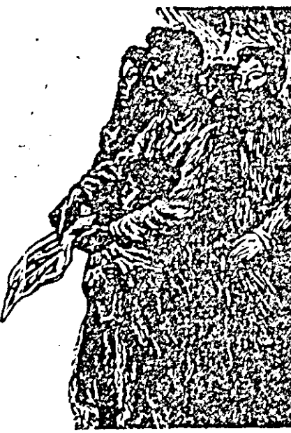
Gravură executată de artistul mexican Leopold Mendez.

Semnături pentru interzicerea armeei atomice