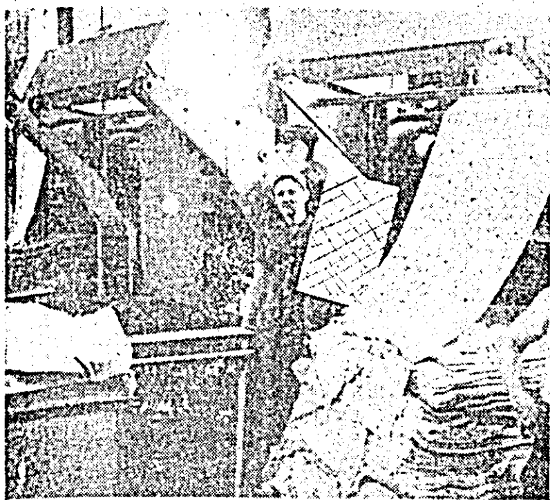
In secția control de calitate.