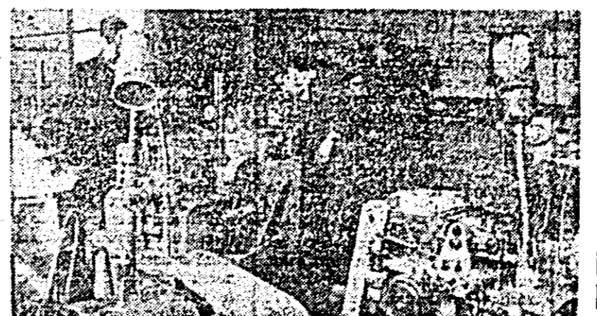
Fabrica de ceasuri „Victoria” Arad. Freze de mare precizie executate dantura la roțile și pinioanele ceasornicilor.

La recentele întîlniri organizate la Școala profesională CFR și Liceul nr. 3 Arad, tinerii au primit răspuns la numeroasele întîrbări pe care le-au pus, întîrbări referitoare la politica externă promovată de partidul și statul nostru, la alte probleme de politică internațională ce frîm-tă lumea contemporană.