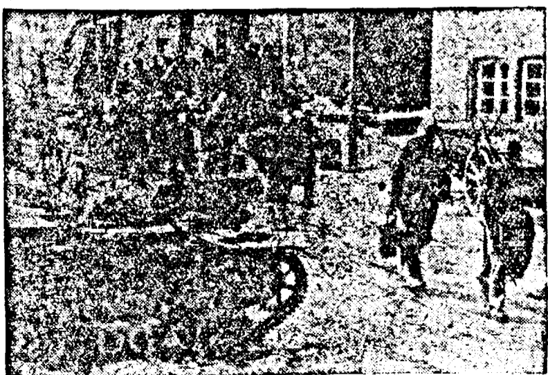
Armata Franceza. Aprovizionarea posturilor avansate.

PORTUL ARMATELOR BRITANICE. UN VAS A FOST SCUFUNDAT, LA HARSTADT, LA 60 KM. DE NARVIK.