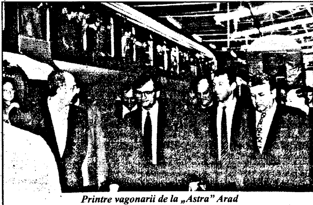
Printre vagonarii de la „Astra” Arad

unei afaceri cu cereale. Cercetările sunt continuate de către specialiștii Direcției de Cercetări Penale și de cei ai Direcției de Combatere a Criminalității Economico-Financiare din IGP.