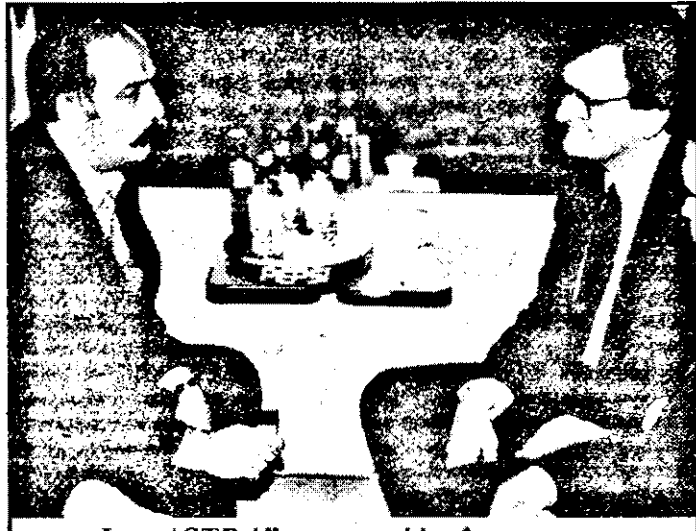
La „ASTRA” - convorbire în... vagon.

▼ Pentru Arad - 10.000 mc de gaze. Întrucât și întârzierea cu Administrația Locală s-a desfășurat tot fără participarea