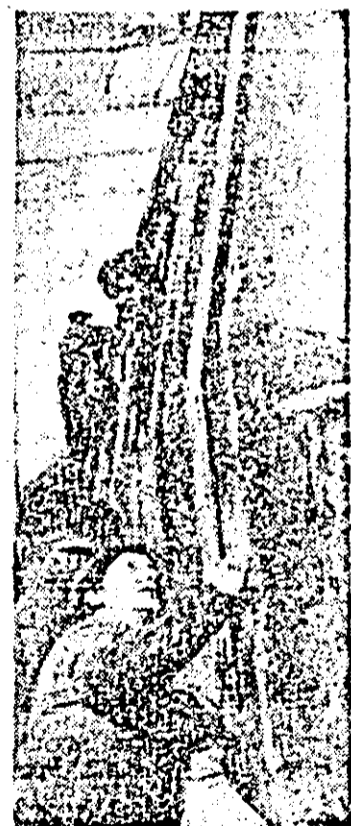
Aspect de muncă în secția montaj a întreprinderii de vagoane.

asimilate în producție tabometrul unghiular stingă-dreapta pentru motoare diesel stabile și amplasate pe locomotive, cit și temporizatorul de 3, 10 și 20 secunde), că au fost modernizate alte trei produse — ceea ce face ca pe 10 luni produsele noi și modernizate să dețină o pondere de 100 la sută în totalul producției. În obținerea acestor realizări o importantă contribuție și-au adus o formație de lucru condusă de Doina Trif și Stefan Recheșan (de la atelierul montaj), Ladislav Zno-rovschi (strunguri automate) și Ion Zigrea (freze).