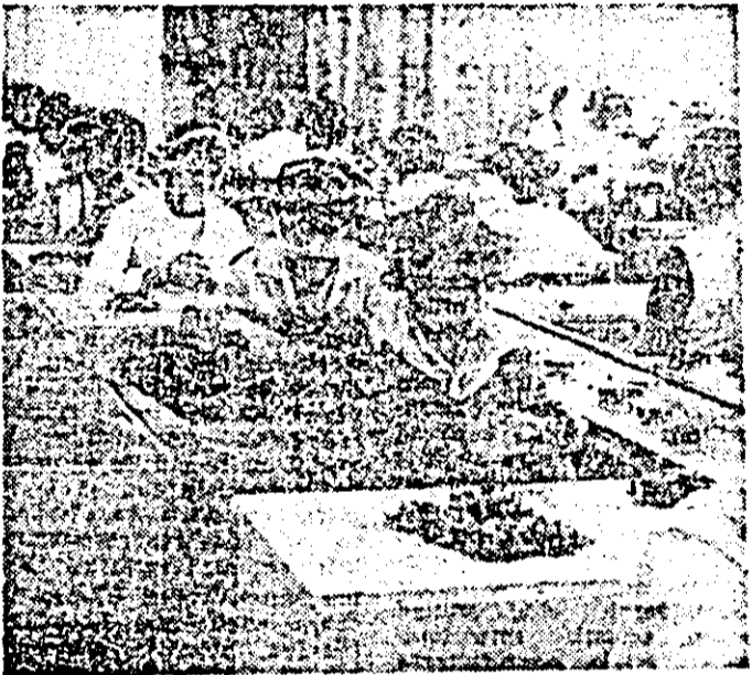
Colectivul de la linia I montaj a întreprinderii „Victoria” este anul dintre colectivele fruntașe în întrecerea socialistă.

mai importante succese înscrise în bilanțul activității productive pe 10 luni de muncii de la întreprinderea de ceasornice „Victoria” din Arad. În prezent, ei acționează susținut pentru ca în perioada rămasă până la finele anului să obțină noi și însemnate realizări în întreaga lor activitate.