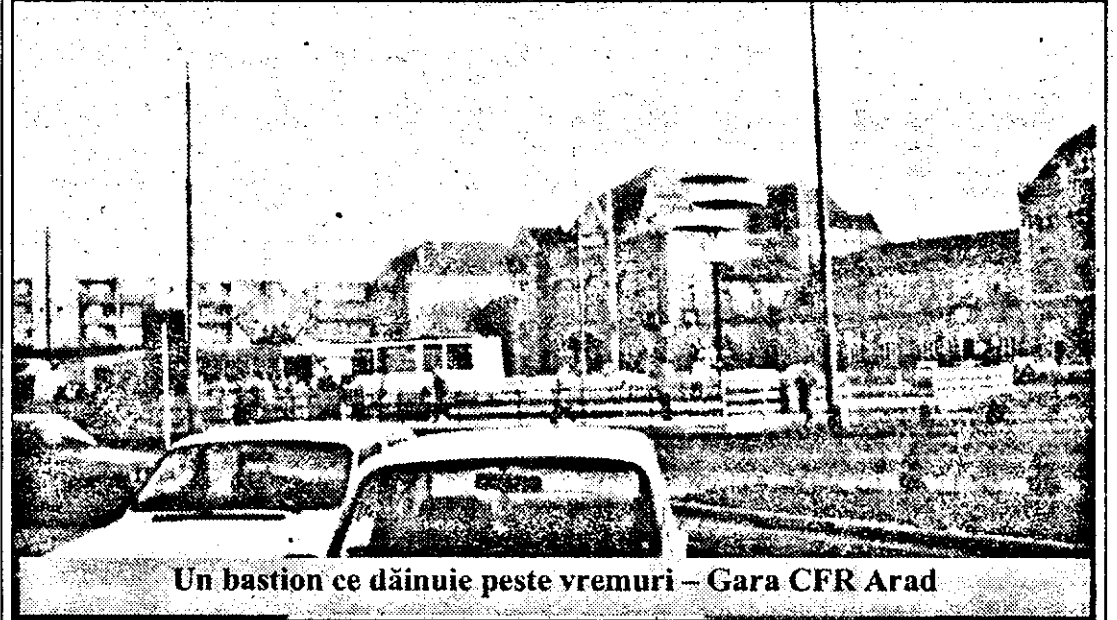
Un bastion ce dăinuie peste vremuri – Gara CFR Arad

Povestea însă nu s-a încheiat – și era normal să fie astfel - o dată cu îndepărtarea din biserică a păsării ucise. Căci un întreg val de proteste s-a ridicat din întreaga Italie, și nu numai din partea grupurilor ecologice, circumstanțele agravante fiind că „un asemenea gest s-a putut petrece tocmai în interiorul unui loc unde, dimpotrivă, ar trebui să se profereze dragostea și caritatea”.