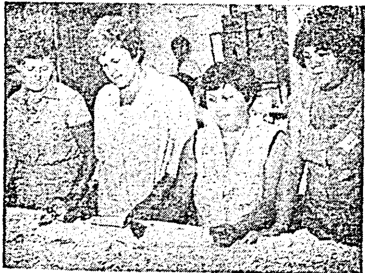
La întreprinderea „Tricoul roșu” — control exigent produselor destinate exportului.