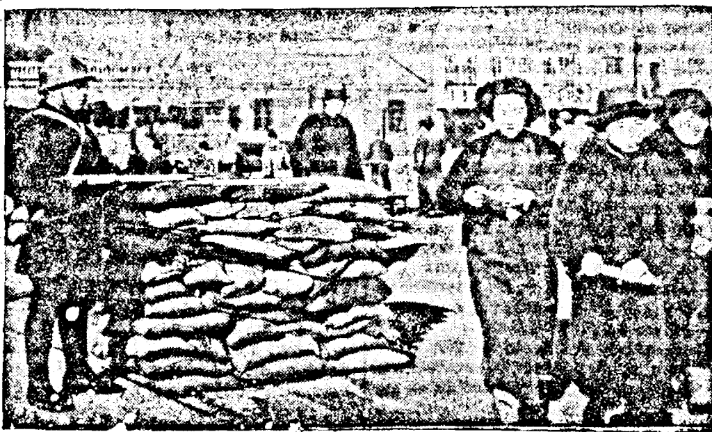
Soldații japonezi, veghiază la menținerea ordinii, chiar în conștința internațională din Shanghai.