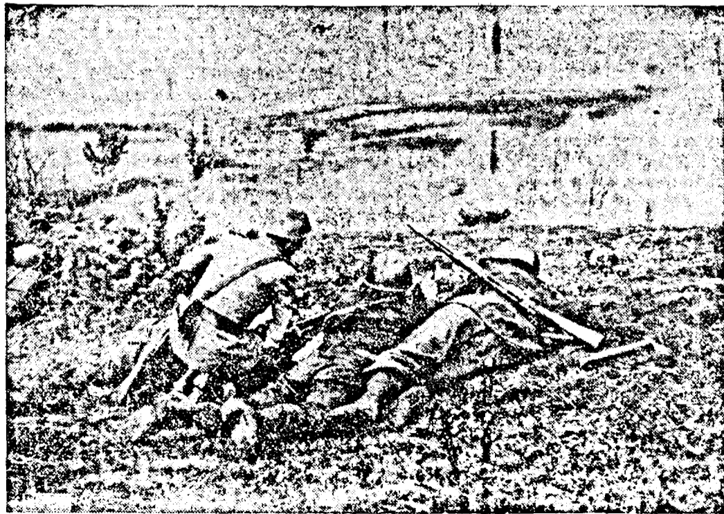
Infanteria italiană atacă o poziție avansată a nemecilor.