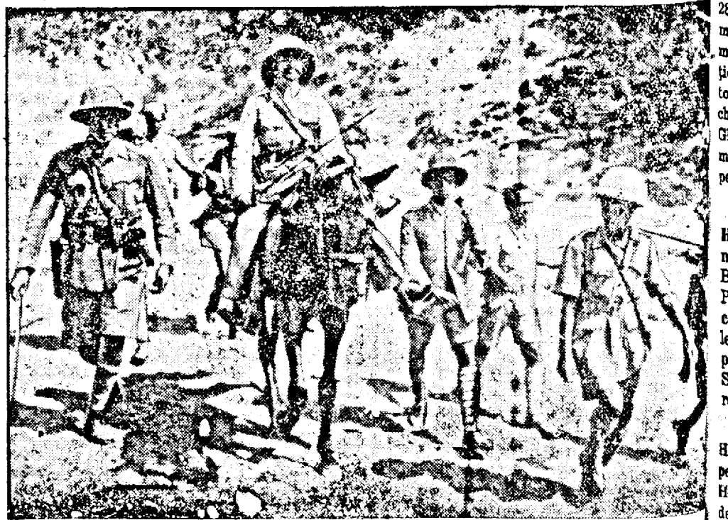
Haille Selassie, reîntorcându-se la Addis-Abeba, întovărășit de ofițeri etiopieni.