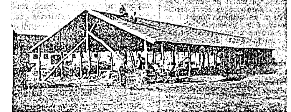
Pînă nu demult, căruțele gospodăriei agricole colective din Sîmartin erau adăpostite într-un șopron acoperit cu trestie, amenajat de colectivități cu 4-5 ani în urmă. Acesta devenise însă netrecător și iată acum se construiește un șopron spațios, acoperit cu țigla.