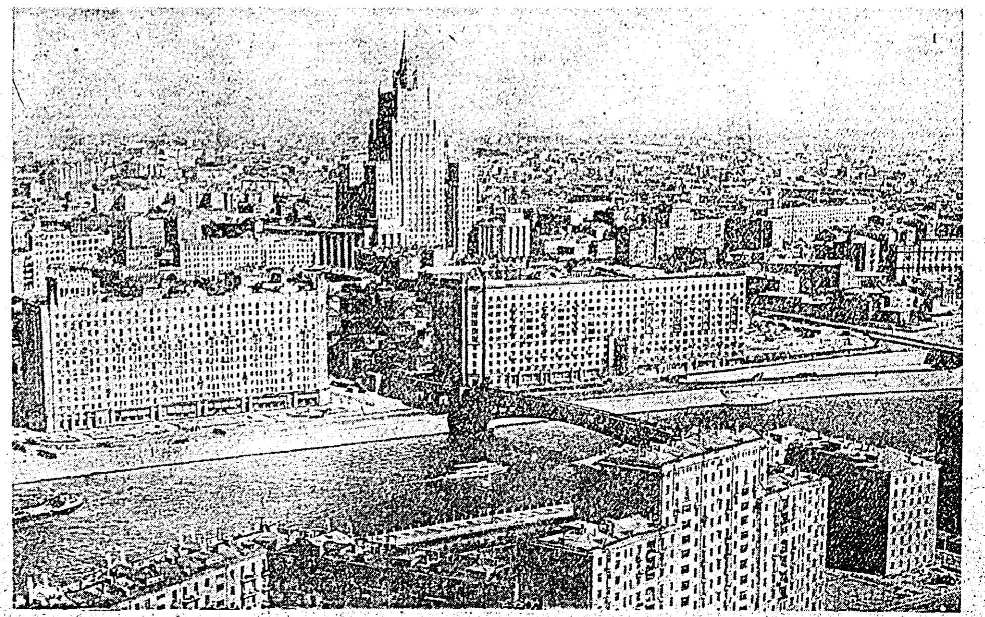
VEDERE DIN MOSCOVA, FRUMOASA CAPITALA A UNIUNII SOVIETICE