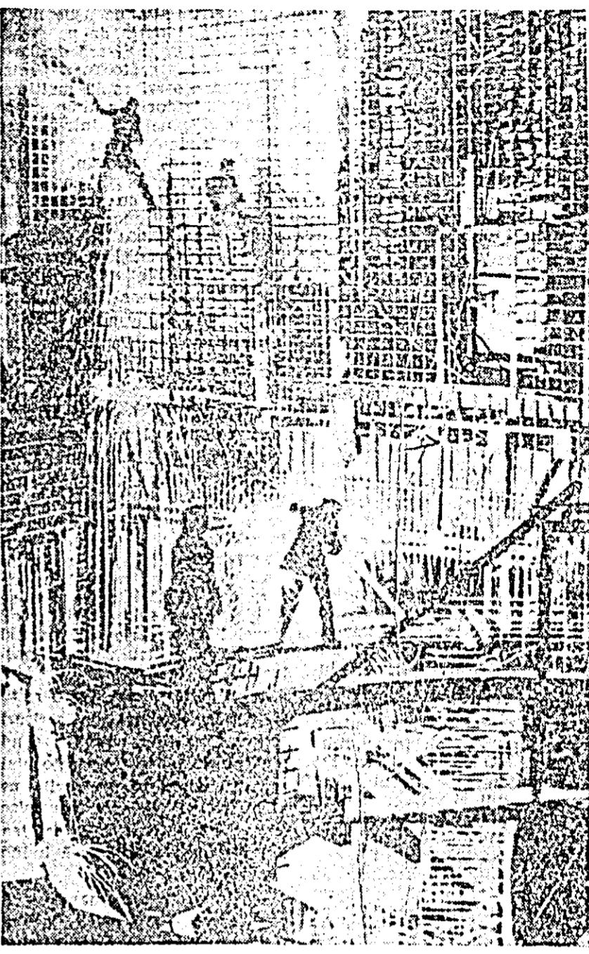
Șantierul de construcție al centralei atomico-electrice de la Voronej

Paralel cu aceasta în URSS se construiește centrala atomico-electrică de la Belovarsk cu o putere de 400.000 kW. În regiunea Voronej se construiește o centrală atomico-electrică de 420.000 kW.