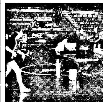
Secvență din finala competiției

În final, iată câteva dintre curiozitățile turneului feminin. BNR București a folosit o jucătoare rusoaică.