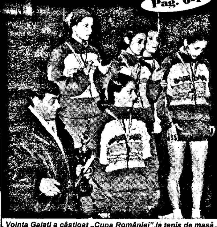
Voința Galați a câștigat „Cupa României” la tenis de masă.

Grijuliu cu cei dornici să intre mai repede în Europa UN ARĂDEAN ȘI-A CREAT O FABRICĂ DE... FALSIFICAT ACTE Pag. 4