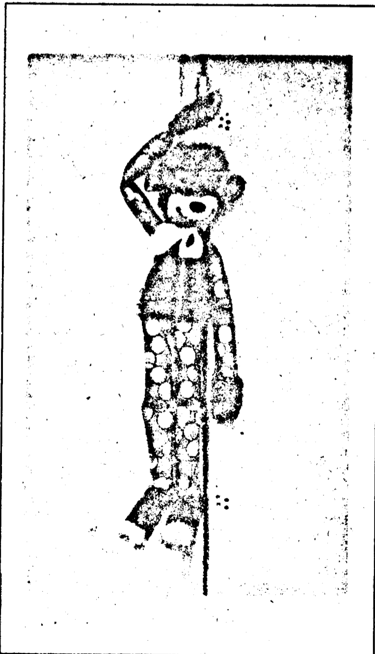
UN MAIMUȚOI BLEG, MANEV RAT DE ALȚII