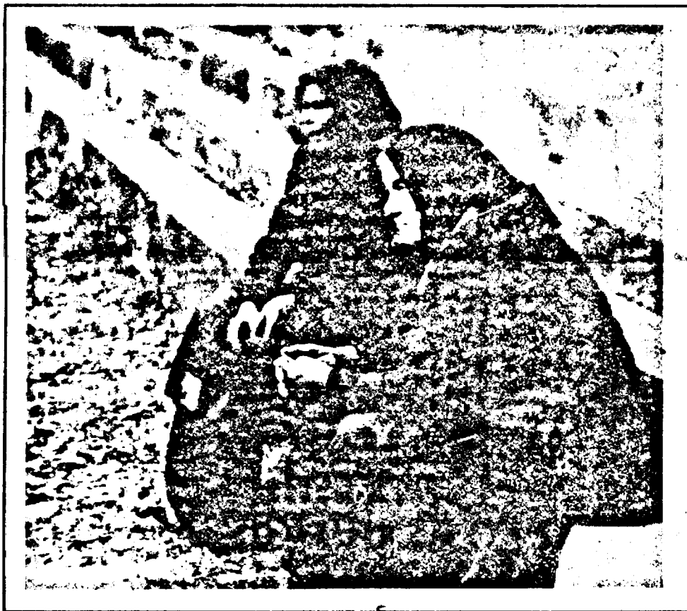
De-am fi primit și noi 18.153 mp. de teren de la primărie ...