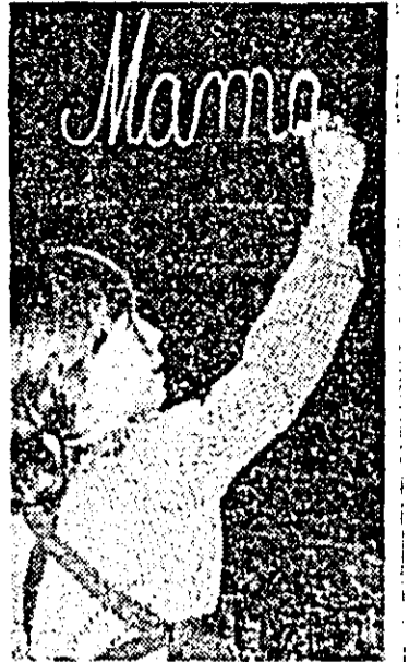
Primul cuvînt rostît de copil și scris de elev — mama — este cuvîntul cel mai drag.