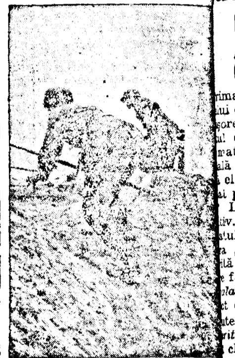
Soldații germani la atac

Roma, 18. (Rador). — Contele Ciano, ministrul afacerilor străine a sosit dimineața în Capitală, venind de la Paris. Pe peronul gării Contele Ciano a fost salutat de reprezentanții autorității partidului fascist.