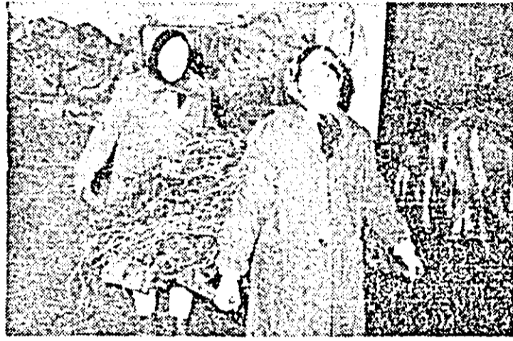
Tot la C.A.P. Odvoș, două îngrijitoare care trebuie să transporte zilnic bălegarul cu targa, urcând și câteva trepte, nu pot îngriji mai mult de 15-16 viței fiecare.

— Și pentru a ne putea face o imagine despre truda lor zilnică, cele două trepte încercă targa cu bălegar și urcă cu ea câteva trepte pentru a ajunge la platforma de gunoi. Da, acum ne-am dăruit de ce două îngrijitoare