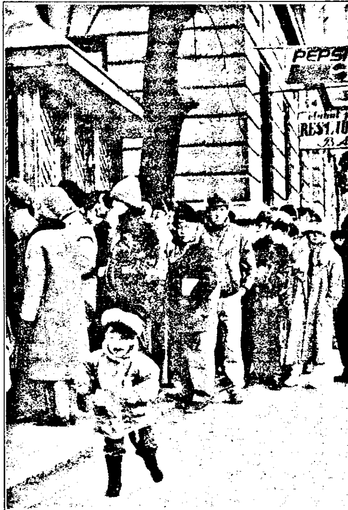
- Mămico, aici se depun bani la „SABA”.