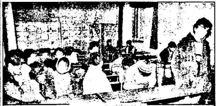
Am răbdat și-am îndurat Până fras am căpătat?