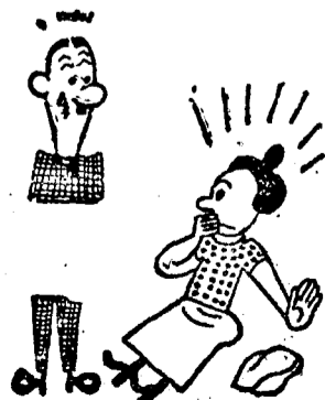
(Hihetetlen történet, három képben.)