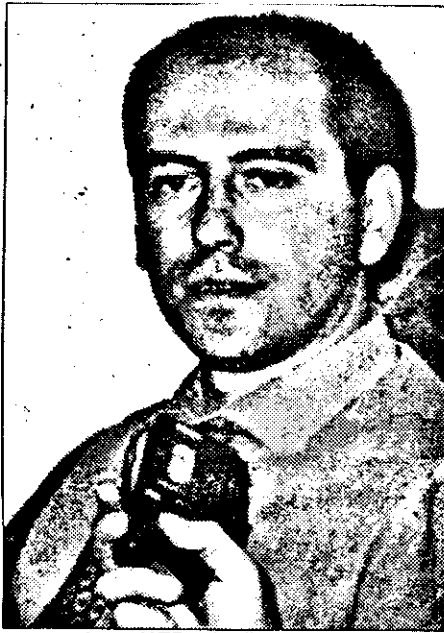
normal ca UFD-ul să se apropie mai degrabă de PNL?

- Totuși, un PNȚCD care a desemnat un prim-ministru aplecat spre stânga, cum spuneți chiar dumneavoastră, încearcă să dreagă bu-suocul, având o mai mare apropiere de asociațiile civice, pentru a contrabalansa o posibilă „defectare” a PNL. S-a vorbit inclusiv de reatragera UFD. În condițiile acestea, nu ar fi mai